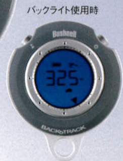
バックライト使用時