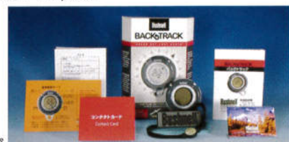
バックトラック 同梱内容